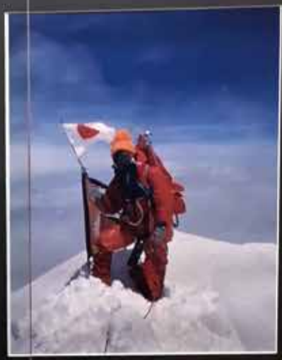
世界最高峰エベレスト 8,848m 頂上 (女性世界初) 1975年5月16日