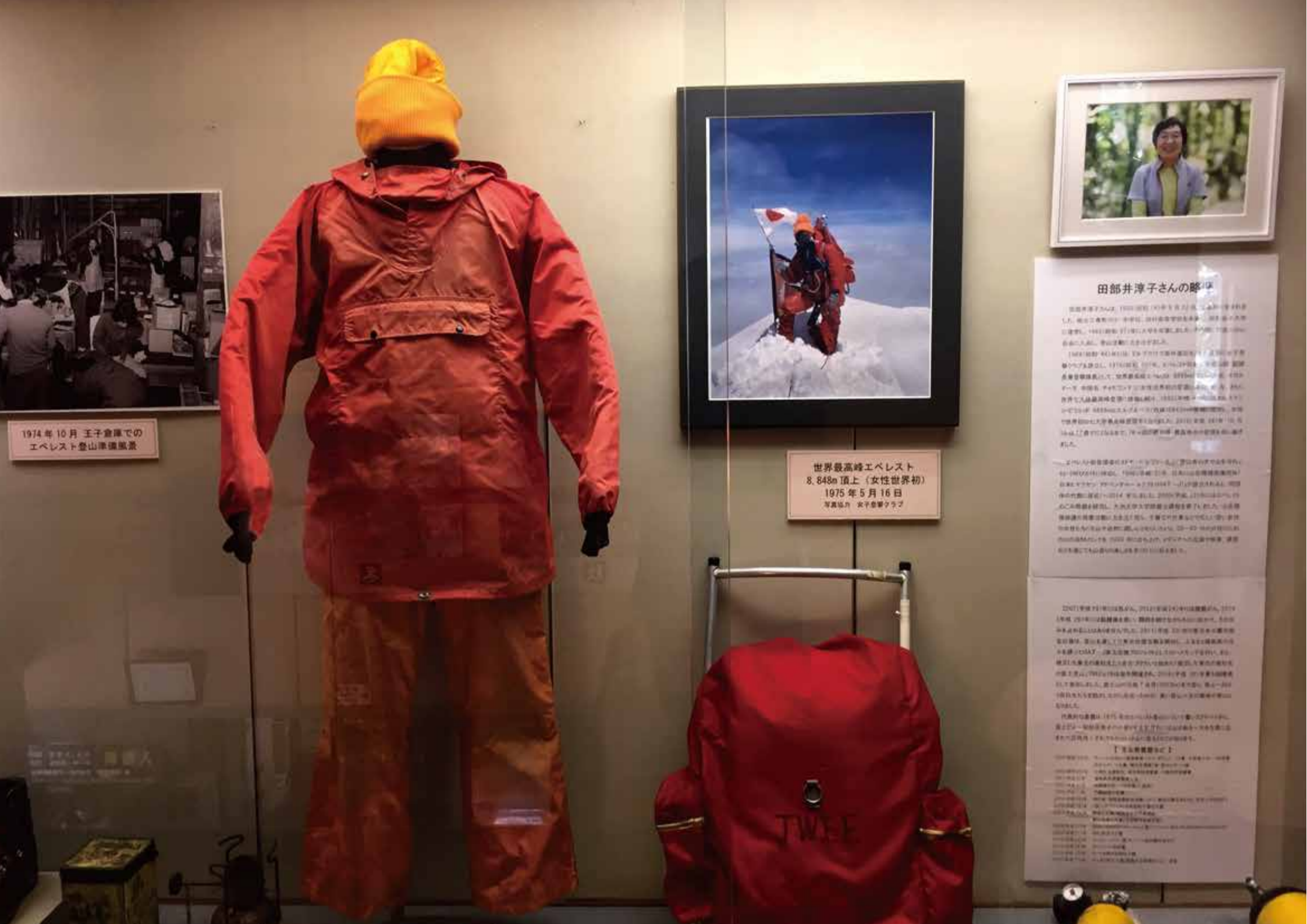
1974年10月 王子倉庫でのエベレスト登山準備風景