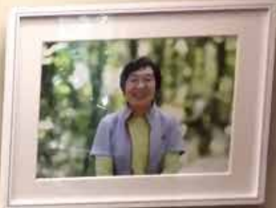
田部井淳子さんの略歴

田部井淳子さんは、1932年(昭和7年)生まれ、山梨県出身の登山家、作家、教師です。1975年5月16日、エベレスト(8848m)の頂上を達成し、女性として初めて世界最高峰に到達しました。1992年には、7大陸の最高峰をすべて制覇し、「セブンサミッツ」の偉業を成し遂げました。また、登山家としての活動だけでなく、児童文学作家としても活躍し、多くの児童書を発表しています。2019年に、山梨県立女子大学で名誉博士号を授けられました。 エベレスト登山の準備風景(1974年10月)と、エベレスト登山の成功(1975年5月16日)の2枚の写真が展示されています。写真は、女子会製クラブのメンバーが撮影したものです。 2019年、山梨県立女子大学で名誉博士号を授けられました。これは、山梨県立女子大学の創立100周年を記念して、山梨県立女子大学の学長が授けられたものです。 【主な著書】 『エベレスト』(1975年) 『セブンサミッツ』(1992年) 『登山家としての人生』(2000年) 『山梨県立女子大学』(2019年)